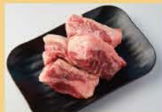
Thick-Cut Short Ribs 《Boneless Short Ribs》 160g 1600