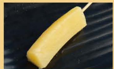
파인애플 스틱 1병 100

크래프트 맥주, non알코올 맥주, 사케는 모바일 오더로 주문 가능합니다. 별도 요금이 발생합니다.