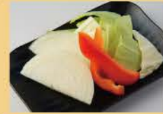
야채 구이 모듬 양파 / 파프리카 / 양배추 400