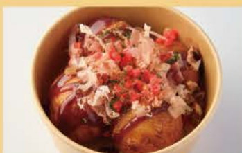
章鱼小丸子 4片 400