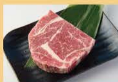
黑毛和牛肋眼 150克 2200

请通过手机点餐 含税 除里脊肉以外(厚切牛肋排/牛腱肉/牛横膈膜/牛舌)均非黑毛和牛