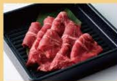
Beef Oyster Blade 100g 1600