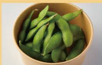
Green Soy Beans 400