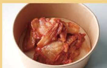
Green Soy Beans 500