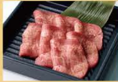
송아지 우설 80그램 1400