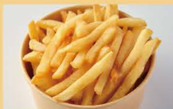
감자 튀김 400