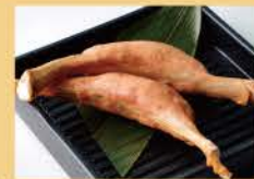
뼈 있는 프랑크 소시지 2병 800