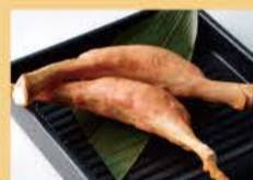
带骨法兰克香肠 2条 800