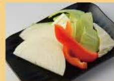
Assortment of Vegetables Onions/Paprika/Cabbage 400