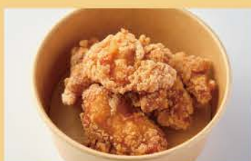
Deep-Fried Chicken 4pcs 400