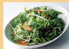
Wrapped Salad 800