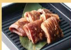
牛横膈膜 160克 1500