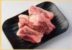
두툼한 갈비살 <살코기> 160그램 1600