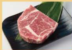
Japanese Black Wagyu Ribeye 150g 2200

*Items other than ribeye (thick-cut kalbi, beef chuck, beef skirt, and beef tongue) not Japanese Black Beef