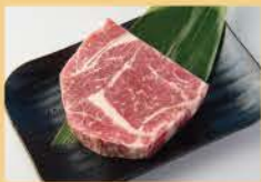
검은 털 일본 소고기 등심 150그램 2200

등심 이외의 부위(두툼한 갈비/소 턱살/소 갈비살/소 혀)는 흑모화우가 아닙니다