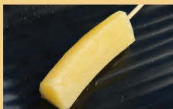
菠萝棒 1条 100