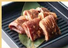
늑간살 160그램 1500