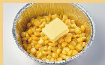
Corn with Butter 500