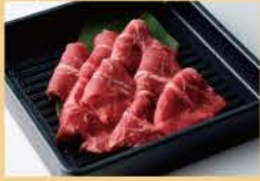
부채살 100그램 1600