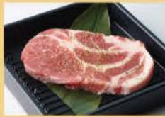
腌制猪肩甲肉 150克 1200