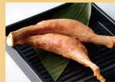
Bone-in Frankfurter 2pcs 800