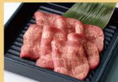
Veal Tongue 80g 1400