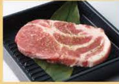
돼지고기 목살 <마리네이드> 150그램 1200