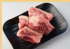
厚切牛小排 (肋条肉) 160克 1600