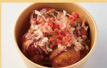
다코야키 4개 400