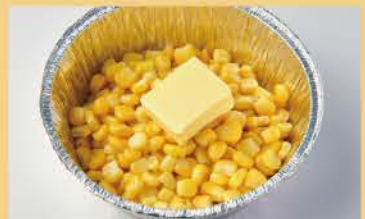
콘 버터 500