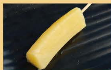
Stick Pine 1pcs 100

Craft beer, non-alcoholic beer, and sake can be ordered using the mobile ordering system for additional charge