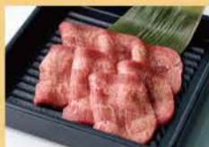
仔牛舌 80克 1400