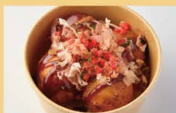
Takoyaki 4pcs 400