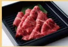
牛板腱 100克 1600