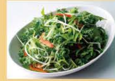
돌돌 만 샐러드 800