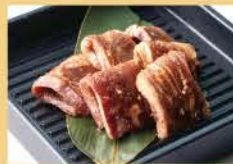
Outside Skirt 160g 1500