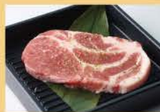
Marinated Pork Shoulder Loin 150g 1200