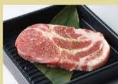
腌制猪肩甲肉 150克 1200