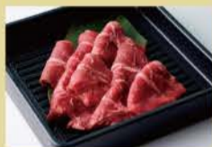
Beef Oyster Blade 100g 1600