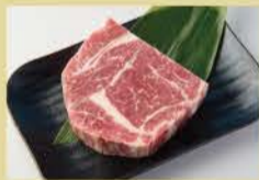
Japanese Black Wagyu Ribeye 150g 2200

*Items other than ribeye (thick-cut kalbi, beef chuck, beef skirt, and beef tongue) not Japanese Black Beef