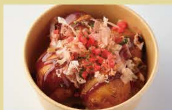
Takoyaki 4pcs 400