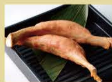
带骨法兰克福香肠 2条 800