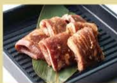
牛横膈膜 160克 1500