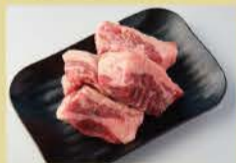
Thick-Cut Short Ribs <Boneless Short Ribs> 160g 1600