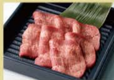
Veal Tongue 80g 1400