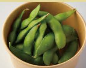
Green Soy Beans 400