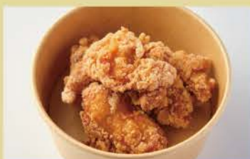
Deep-Fried Chicken 4pcs 400