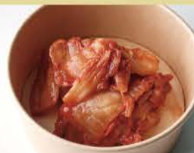
Green Soy Beans 500