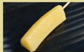
菠萝棒 1条 100