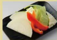
Assortment of Vegetables Onions/Paprika/Cabbage 400