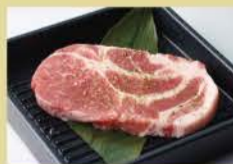
Marinated Pork Shoulder Loin 150g 1200