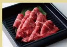
牛板腱 100克 1600