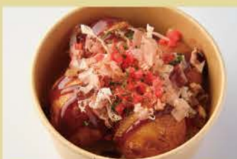
章鱼小丸子 4片 400