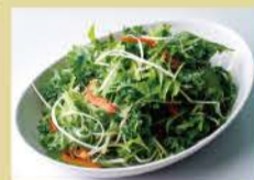
Wrapped Salad 800