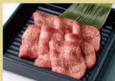
仔牛舌 80克 1400