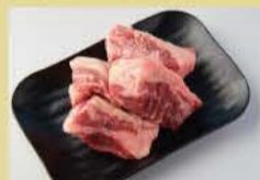
厚切牛小排 (肋条肉) 160克 1600