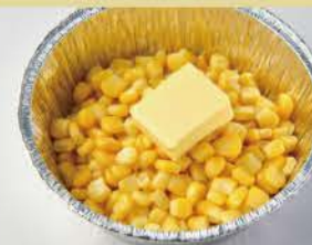
Corn with Butter 500