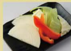
烧烤蔬菜拼盘 洋葱 / 甜椒 / 卷心菜 400