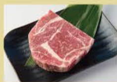
黑毛和牛肋眼 150克 2200

请通过手机点餐 含税 除里脊肉以外 (厚切牛肋排/牛腱肉/牛横膈膜/牛舌) 均非黑毛和牛