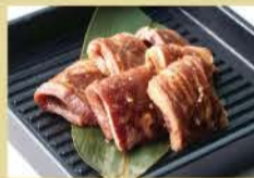
Outside Skirt 160g 1500