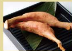
Bone-in Frankfurter 2pcs 800